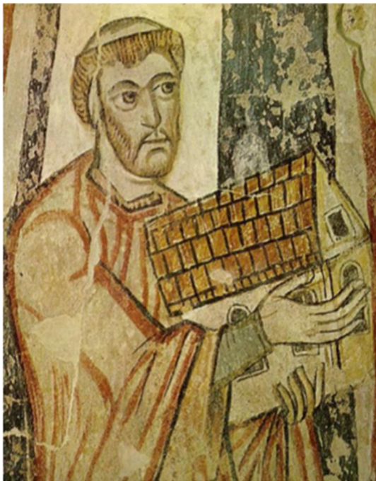
ASSOCIAZIONE SAN BENEDETTO AMICI DELLE OPERE DI CARITA'