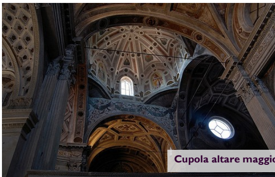
Cupola altare maggiore

Bonifacio di Canossa nel 1016, fece costruire la grande chiesa abbaziale, nel luogo dell'attuale, mentre Matilde di Canossa donò il monastero al pontefice Gregorio VII, il quale, a sua volta, l'affidò a Cluny.