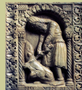
Mese di novembre

Nel prestigioso Refettorio costruito nel 1478, è conservato un grande affresco che il Correggio (attribuzione) dipinse nel 1514.